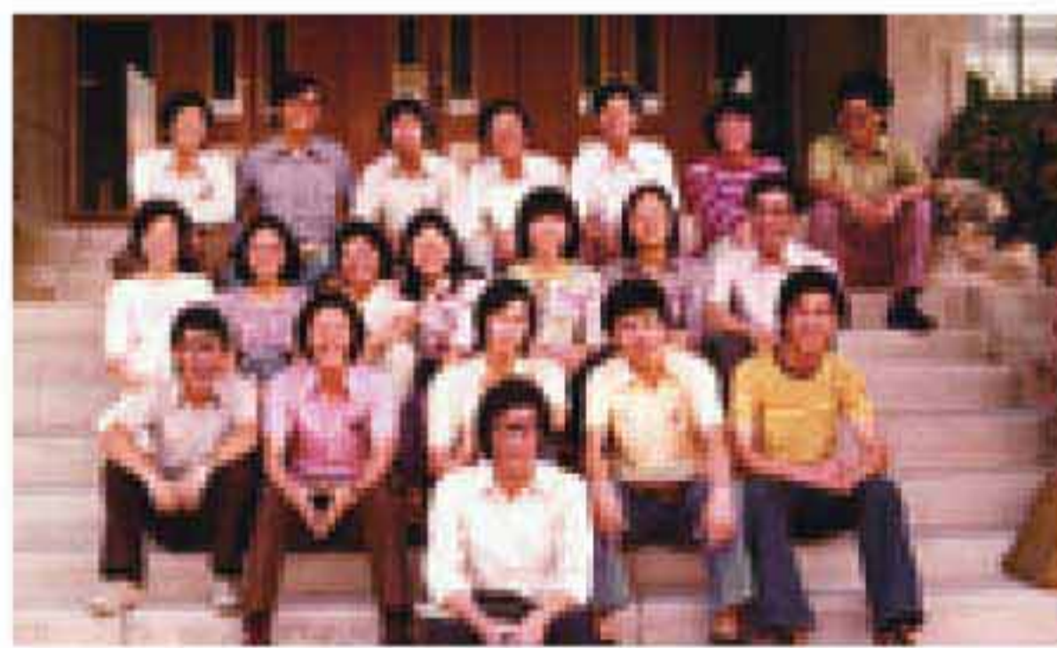
▲▼回味中大的日子，既有苦學，也有動若脫兔的一面。

「本來四月已決定了回來，但香港忽然出現沙士疫潮，計劃被迫擱置。」原來，敬祥林亦有涉足中藥研究，他的碩士論文，便是做一隻有避孕功能的中草藥，導師正是前中大醫學院院長江潤祥。「我相信將來做中藥的成份控制會是一個大發展方向，其實我們藥廠也有做natural food product，有這方面的技術，有機會我會想嘗試。」